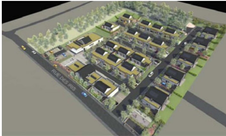
Perspective du projet