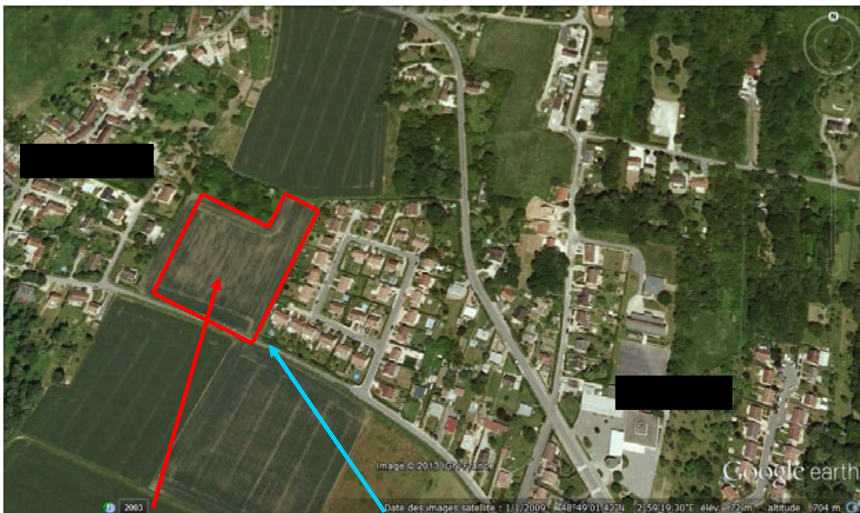
Situation du projet dans le quartier

La présente enquête publique doit permettre d'établir l'intérêt général du projet emportant mise en compatibilité du Plan d'Occupation des Sols (POS) de la commune.