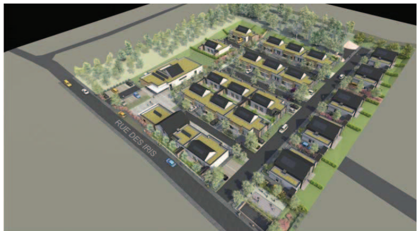
PERSPECTIVE Aérienne du PROJET - Angle SudiEst

Ce programme de constructions présente la particularité de répondre à la volonté commune de la municipalité et du maître de l'ouvrage à ce que ce nouveau quartier puisse être le lieu de rencontres intergénérationnelles. Il offre également la possibilité d'intégrer à cette opération de logements deux équipements publics (un