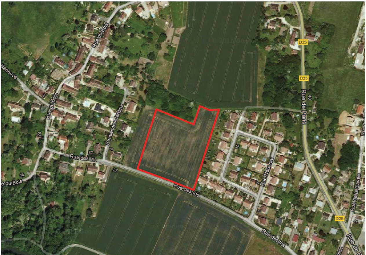
(Extrait : Photo aérienne-2011)

Afin de permettre la réalisation du projet, la commune de POMMEUSE envisage la cession des terrains au lieu-dit La Ruelle NEUVRAY, à l'entrée Ouest, le long de la rue des IRIS, à la Société LOGIVAM du Groupe PROCILIA.